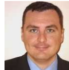
Gerardo Gavilanes Ginerés Subdirector General Ministerio de Fomento